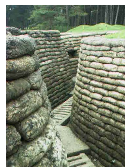
Vimy n'est pas célèbre que pour son mémorial Canadien