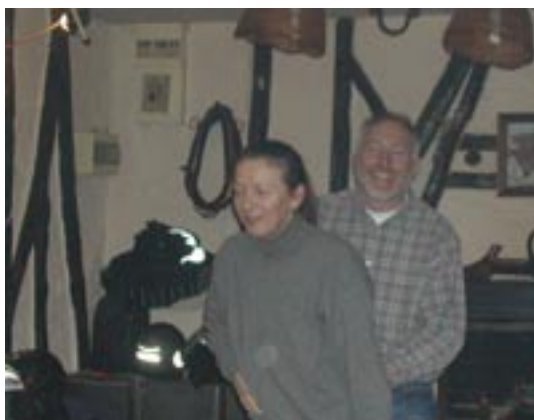
On s'est éclaté les babouches