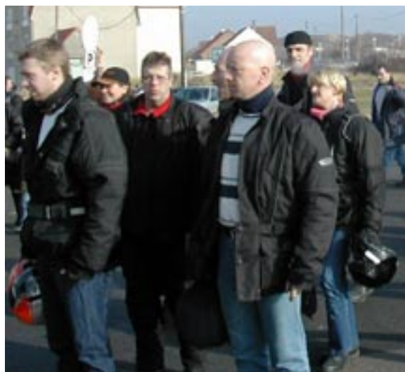
Tous à Stella. Tout compte-fait il y a moins de monde et l'ambiance motarde est tout de même au rendez-vous