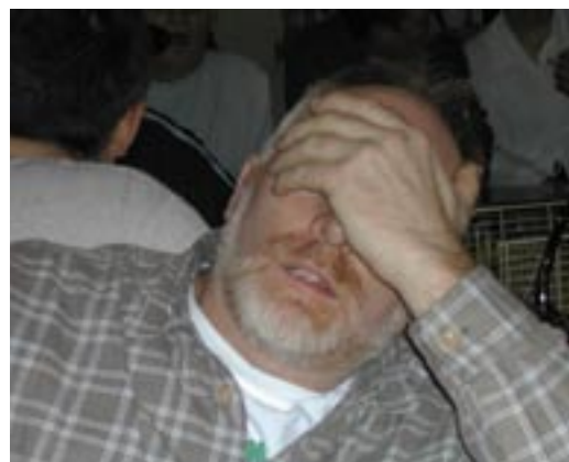
Grosse fatigue quand on n'a pas l'habitude