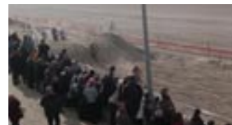
un petit aperçu tout de même de la course