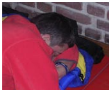
GROS DODO El Zidento