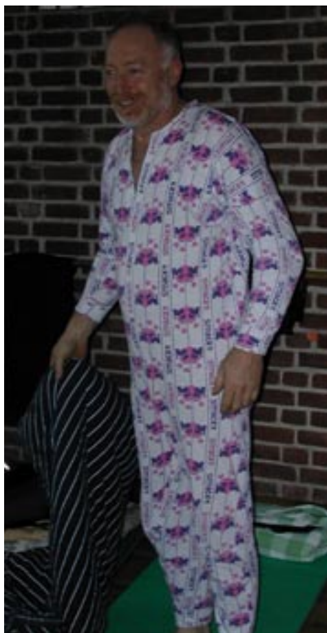
C'est l'heure du dodo. SEXY !!!!