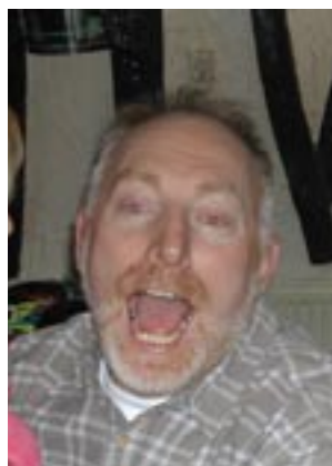
La joie d'être entre amis, quel pied !