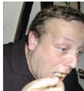
une petite bouffe avant de partir

P.S. bien qu'il n'y ait pas de photos de la ballade, je saluerai le magnifique parcours qu'Eric nous a concocté.